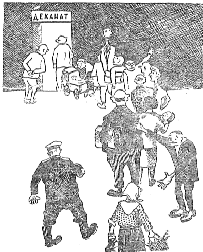
Родственники атакуют деканат... Рис. Т. Пляхтур и В. Ореханова.

Из семестра в семестр эти горе-студенты волокли за собой длинные «хвосты» по многим предметам, прогуливали сотни часов. В институте они появлялись лишь для того, чтобы провести время. Попов даже умудрялся спать на лекциях по политической экономии. К началу весенней сессии этого года он пришел без трех зачетов. А зачет по физ-